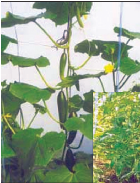
Cetrioli e pomodori in una serra, su terreno non trattato. Esso è stato solamente innaffiato con TerraBiosa attivata e poi coperto con legno di scarto tagliuzzato.