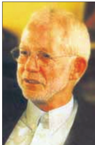
Il medico danese della Radio della TV, Carsen Vagn-Hansen, consiglia VitaBiosa ai suoi ascoltatori e spettatori della TV.

antiossidante. In particolare il germe di riso contiene molte sostanze antiossidanti e vitamine. Il suo strato esterno è composto di fibre importanti per la dieta. Con l'assunzione di queste fibre efficaci dal punto di vista dietetico, nell'intestino si moltiplicano molti microrganismi utili mentre si impedisce lo sviluppo di germi nocivi. Queste fibre si uniscono a sostanze radioattive, metalli pesanti, prodotti chimici e