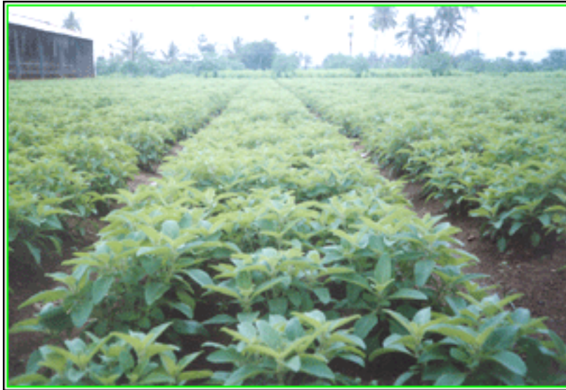
Campo di coltivazione di Coleus forskohlii , pianta dalla quale viene estratto il Forslean