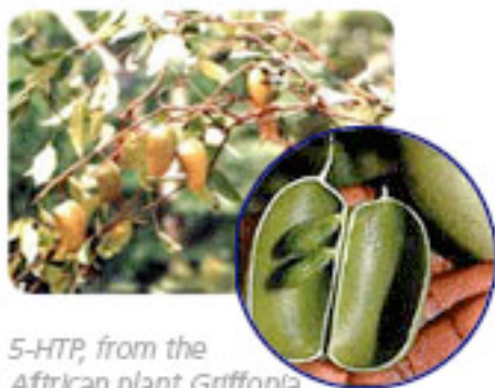
5-HTP, from the African plant Griffonia simplicifolia.

5- HTP è un amminoacido prodotti dalla pianta africana Griffonia simplicifolia che agisce come spezzafame naturale e potente.